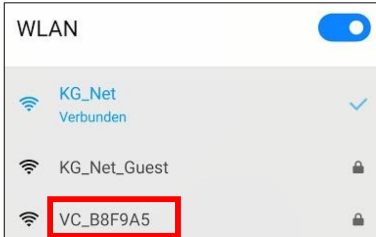
Abbildung 1 Beispiel WLAN-Netz auswählen (Ziffern hinter VC_ sind bei jeder Vertical Clock individuell!)